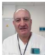
Julio Iglesias Expósito